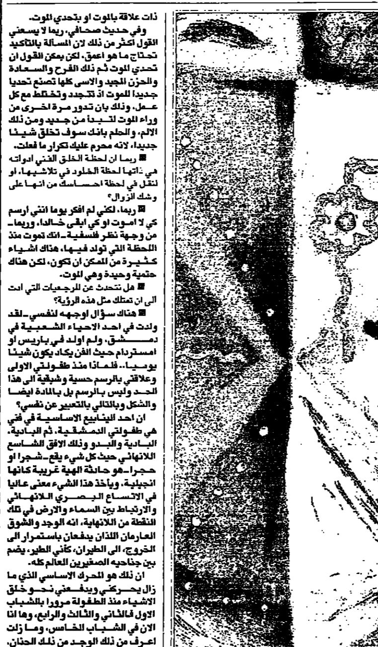
لوحة برسوم على الجدران 1957

لا يوجد رسام في العالم او في التاريخ اتخذ من الوجة الانساني مركز الخلق الفني. وسكان لانان و ايريسن عساير التصني على الفني بهذا الوجة وسيرته التي هي سروري الفنية والذاتية. وقد تحولت ووجه سيرته وسيرته التي هي سروري الفنية والذاتية.